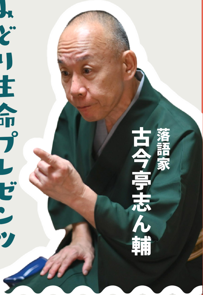
落語家 古今亭志ん輔